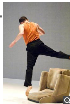
« You're a bird, now! » plaira aussi aux enfants, à partir de 6 ans.