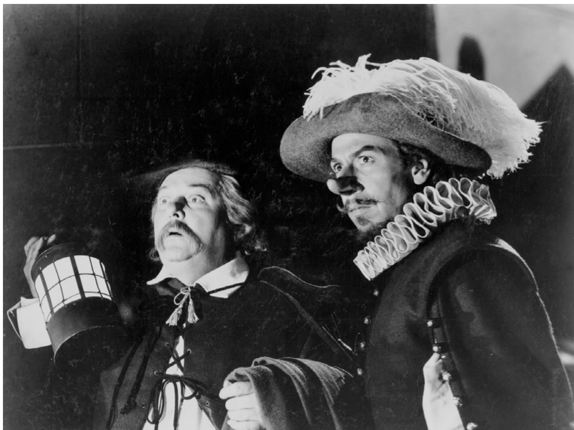
Lloyd Corrigan et José Ferrer dans Cyrano de Bergerac , 1950.