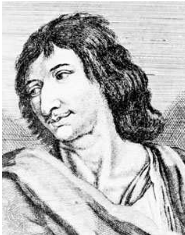
Savinien, Cyrano de Bergerac. Gravure tirée du Recueil de portraits d'Étienne Jehandier Desrochers (1726).