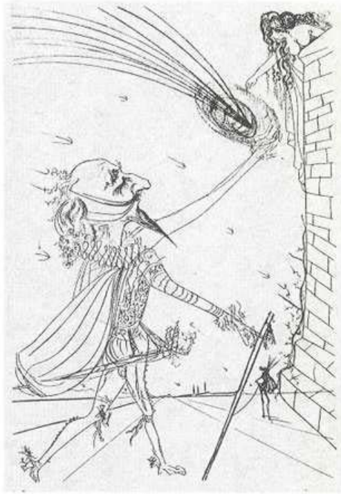
Dali, La plume de Cyrano.