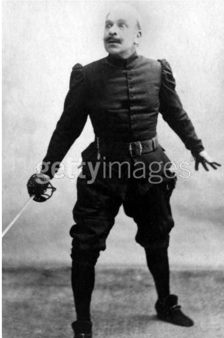
Constant Coquelin, le premier Cyrano choisi par E. Rostand

« C'est à l'âme de Cyrano que je voulais dédier ce poème. Mais puisqu'elle a passé en vous, Coquelin, c'est à vous que je la dédie. » E.R.