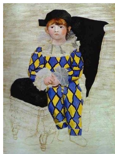
et Paulo Picasso en Arlequin

Les liens que Pablo Picasso a entretenus avec le monde du cirque ont été très fréquents tout au long de sa carrière. Dans la Barcelone du tournant du XIXe siècle, Picasso va voir les cirques de passage dans la ville, bien qu'il ne reste aucune trace de ce moment dans son oeuvre. Plus tard, les cirques ambulants des boulevards de Paris deviendront un lieu de rendez-vous habituel pour le jeune Picasso et ses amis lors de leurs premiers séjours dans cette ville. C'est à la fin de l'année 1904 et en 1905 que le cirque - le Medrano est un point de référence dans sa vie et dans son oeuvre - s'érige en thème central de ses compositions de l'époque. L'artiste crée une scène fictive où des acrobates et des équilibristes - qui apparaissent déjà dans la tradition littéraire et picturale du romantisme pour symboliser la solitude et la souffrance humaine - jouent des rôles de la vie quotidienne, expriment leurs