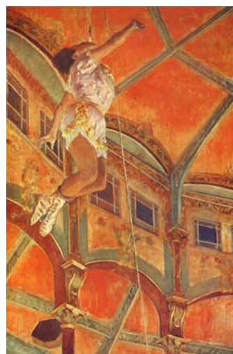
Degas Edgar Miss Lola au Cirque