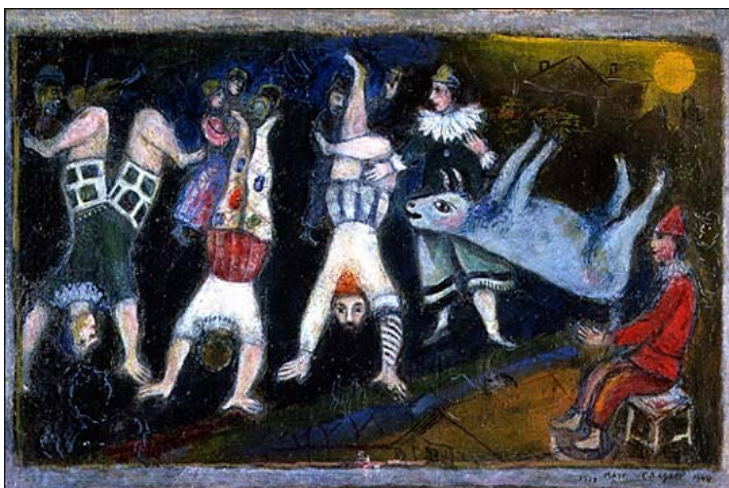
MARC CHAGALL Le Cirque , huile sur toile, 1922-1944 Fernando 1879