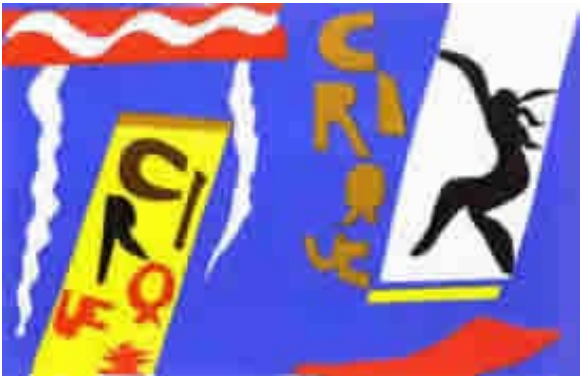
Henri Matisse, Le Cirque , 1947 papiers découpés et collés

On peut envisager un travail qui reprend les œuvres de Picasso au cours de sa vie, dans chacune de ses périodes, on trouve le thème du cirque et ainsi il est possible de voir l'évolution des différents mouvements de l'art au XX ème siècle.