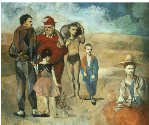
Picasso Famille de saltimbanques