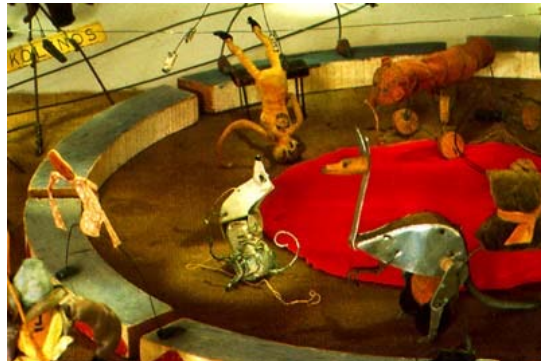
Le cirque de Calder