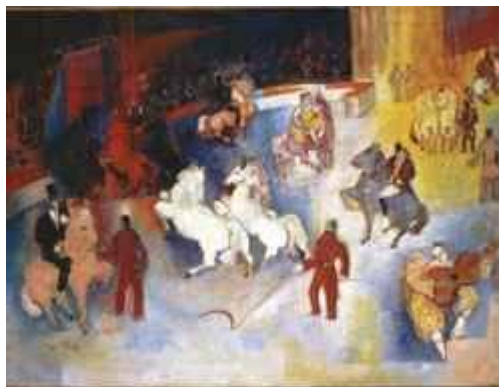
Dufy. Le Cirque