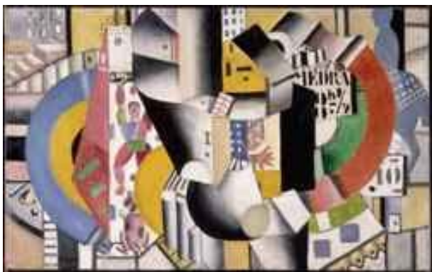
Léger. Cirque Medrano

Reproduction de quelques œuvres d'artistes cités précédemment