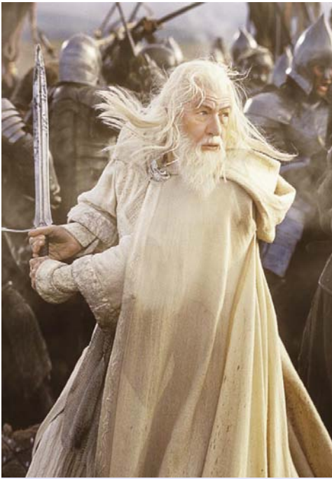
Gandalf le Gris (Ian McKellen) dans la trilogie "Le Seigneur des anneaux", réalisée par Peter Jackson (de 2001 à 2003)

D'autres œuvres, en général connues des élèves par le biais de leur adaptation cinématographique, empruntent une part conséquente de leur imaginaire à l'histoire de Merlin et des chevaliers de la Table Ronde. C'est le cas du Seigneur des anneaux de J.R.R. Tolkien. On peut par exemple comparer la relation entre Merlin et Arthur à celle qui lie Gandalf et Aragorn, et il est fort possible que l'image de Gandalf dans le film s'impose à l'imaginaire des élèves quand ils essaieront de se représenter Merlin.