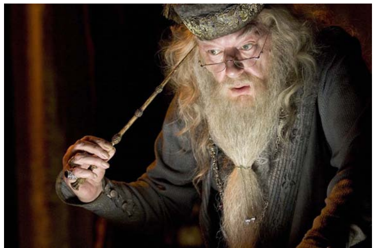
Albus Dumbledore (Michael Gambon) dans les films d'Harry Potter réalisés par Chris Columbus (2001 et 2002), Alfonso Cuarón (2004), Mike Newell (2005) et David Yates (2007 à 2011)

D'autres œuvres, en général connues des élèves par le biais de leur adaptation cinématographique, empruntent une part conséquente de leur imaginaire à l'histoire de Merlin et des chevaliers de la Table Ronde. C'est le cas du Seigneur des anneaux de J.R.R. Tolkien. On peut par exemple comparer la relation entre Merlin et Arthur à celle qui lie Gandalf et Aragorn, et il est fort possible que l'image de Gandalf dans le film s'impose à l'imaginaire des élèves quand ils essaieront de se représenter Merlin.