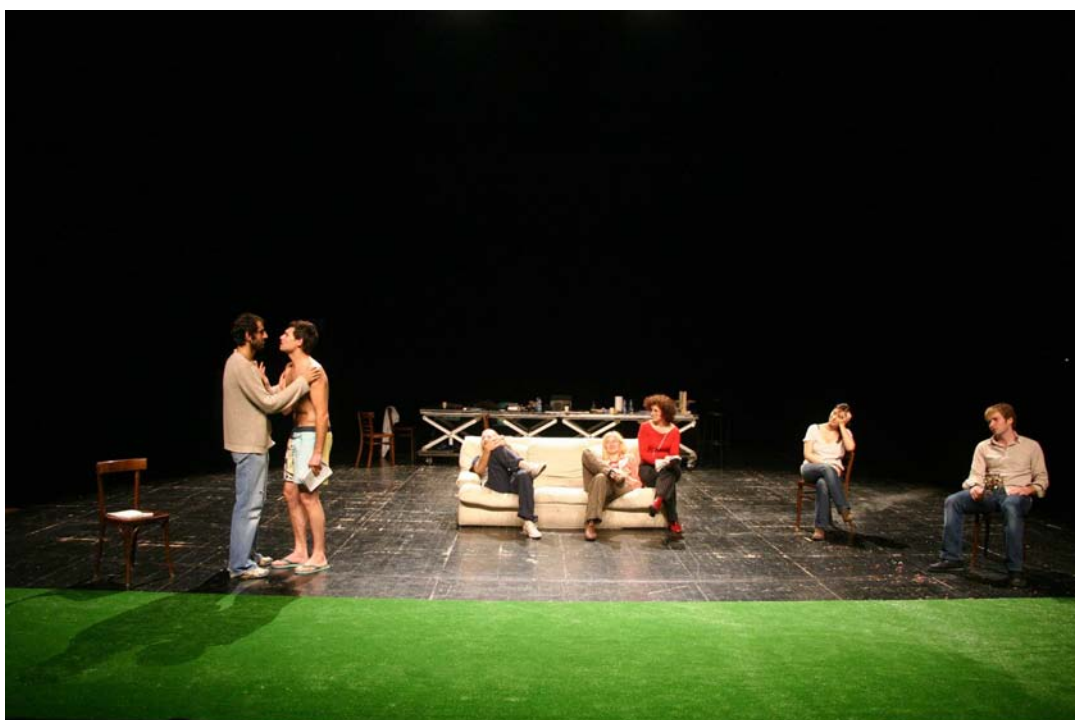
Le Pays Lointain, le Collectif Les Possédés, création 2006