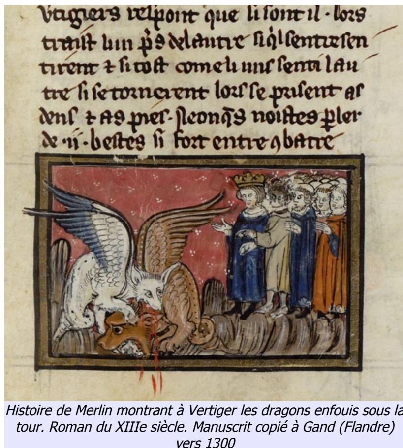
Histoire de Merlin montrant à Vertiger les dragons enfouis sous la tour. Roman du XIIIe siècle. Manuscrit copié à Gand (Flandre) vers 1300