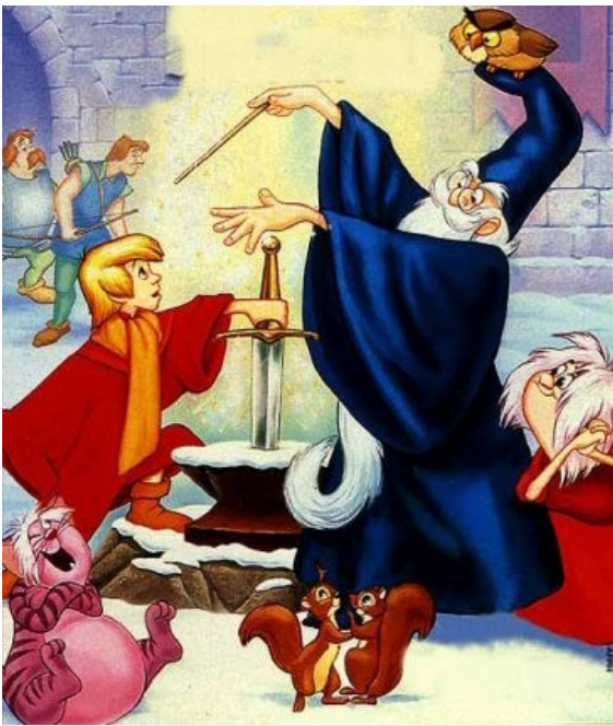
"Merlin l'enchanteur" de Walt Disney (1963)

Demander aux élèves ce qu'ils savent de Merlin, d'Arthur et de la Table ronde (péripiéties de l'histoire). Leur demander de décrire comment ils voient Merlin, Arthur et les chevaliers de la Table Ronde.