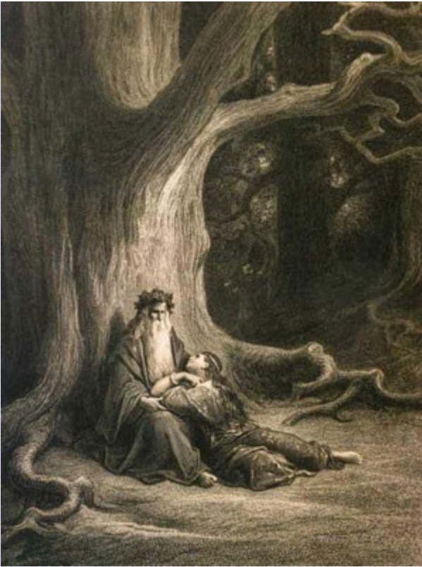
«Merlin l'enchanteur et la fée Viviane dans la forêt de Brocéliande »